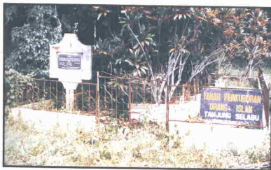
Tanah Perkuburan Islam Tanjung Selabu