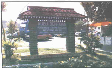
Gambar Kubu Bentayan sekarang di tepi Sungai Bentayan Jalan Salleh, Muar

Ramai para pahlawan Melaka tewas dan gugur di kubu ini yang dikatakan berperang secara berdepan-depan dan berbantai-bantaian yang kemudiannya kubu ini dikenali Kubu Bentayan daripada perkataan berbantai-bantai. Bersempena sambutan 100 tahun Muar pada bulan Ogos 1984 satu papan tanda telah diletakkan di kawasan kubu ini.