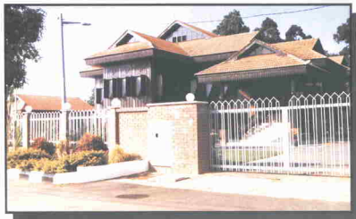
Gambar rumah Kediaman Yang Amat Berhormat Daio' Hj. Abd. Ghani Bin Othman, Menteri Besar Johor di Pekan Sungai Mati

Sungai Muar yang berliku-liku itu terdapat beberapa kawasan penempatan seperti Pantai Layang, Rawang dan lain-lain. Di Pantai Layang terdapat satu kawasan tanah perkuburan lama yang dikatakan terdapat perkuburan orang Bugis daripada keturunan Pahlawan Melayu Bugis Lima Bersaudara yang pernah menguasai Alam Melayu pada satu ketika lalu di Nusantara.