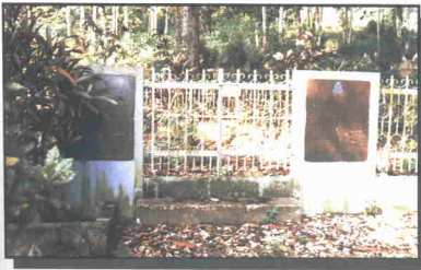
Gambar perkuburan mangsa-mangsa yang terkorban dalam peristiwa Bukit Kepong.

Bukit Kepong yang tidak jauh dari Segamat dan Jementah, kini membangun bersama-sama dengan wawasan bangsa.