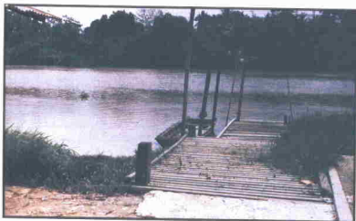
Gambar pengkalan yang terdapat di Tanjung Selabu

Satu tragedi pernah berlaku di pengkalan sungai kampung ini beberapa tahun lalu. Sekumpulan murid sekolah telah dihanyutkan arus ketika hendak menyeberangi sungai untuk ke sekolah. Pagi yang hening itu telah menyaksikan perahu yang dikayuh mereka dihanyutkan arus deras sungai ini.