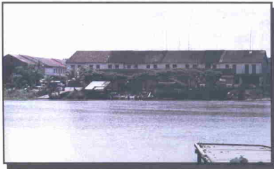
Gambar jeti Pekan Gersik, Muar.

Sebuah kilang getah kepunyaan RISDA pernah di buka di sini dan kini masih berfungsi sementara itu tanah persawahan yang luas tidak jauh daripada tempat ini ialah Sawah Sungai Ring, yang diterokai pada mulanya oleh Orangkaya Cekah.