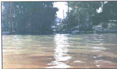
Gambar Kuala Sungai Tiram Muar

Tetapi sayangnya sekali hasil hidupan laut itu kini telah hampir-hampir pupus, termasuk 'sinting' yang sudah pupus sama sekali.