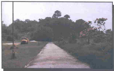
Gambar Pemandangan Bukit Terih

Dahulu Bukit Terih merupakan tempat penampungan air yang disalurkan dari Gunung Ledang untuk kegunaan penduduk Muar tetapi kini, air yang digunakan oleh penduduk Muar datangnya dari Sungai Muar.