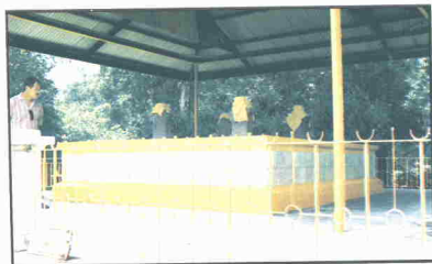
Gambar makan Sultan Alauddin Riayat Shah (1) di Kampung Raja Pagoh, Muar.

Pagoh adalah asas penempatan kawasan hulu Muar dengan beberapa kesan sejarah silam yang menjadikan sungai Muar sebagai penghubung utama dengan Empayar Kerajaan Melayu Melaka.