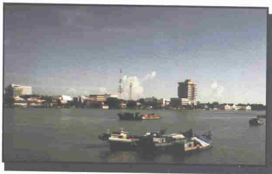
Pemandangan di Kuala Sungai Muar

Bangunan lama yang masih terdapat di tepi sungai Muar ini ialah bekas bangunan pasar awam Muar, yang kini dijadikan perhentian bas Pagoh.